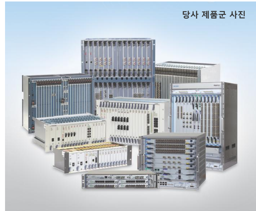
당사 제품군 사진

백본급에서 액세스급에 이르는 전용회선 장비, MSPP장비, 캐리어 이더넷 장비 분야에 있어 국내최고의 기술력을 보유하고 있으며, 이를 기반으로 해외시장 개척과 신규 사업 분야 진출을 통해 2017년 매출 1천억원을 목표로 하는 글로벌 강소기업으로 한 단계 도약하고자 합니다.